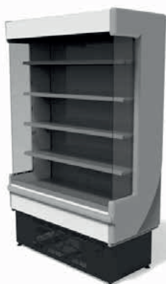
MONTBLANC 680 BRANCO