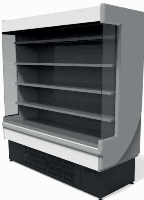
MONTBLANC 980 BRANCO