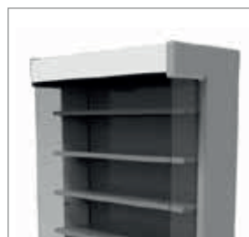
Luz LED incluída.