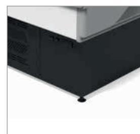
Botão de ativação e desativação.