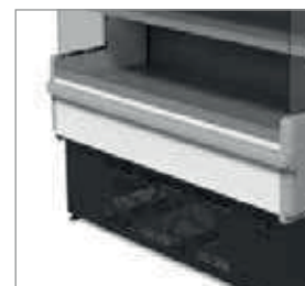
Proteção contra impactos de série.