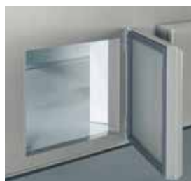
Reserva refrigerada com portas articuladas.