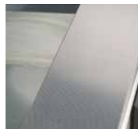
Mesa de trabalho em aço inoxidável.