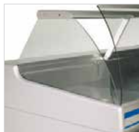
Vidro frontal curvo e rebatível.